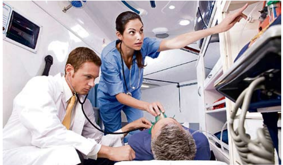
Infarkte lassen sich besser vermeiden, wenn ...

Derzeit sind vor allem zwei Arten von Gefässstützen im Einsatz. Unproblematisch ist keine: Blanke Metall-Stents können eine Überreaktion beim Zellwachstum auslösen. Geschieht dies, wuchern die