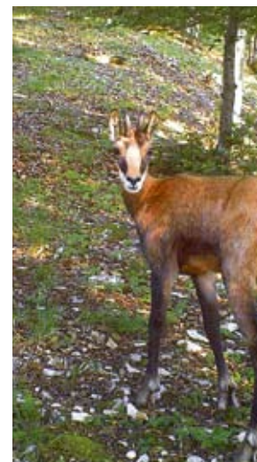
Voll erwischt: Wildschwein, Gämse und Luchs lösten die Fotofallen aus.