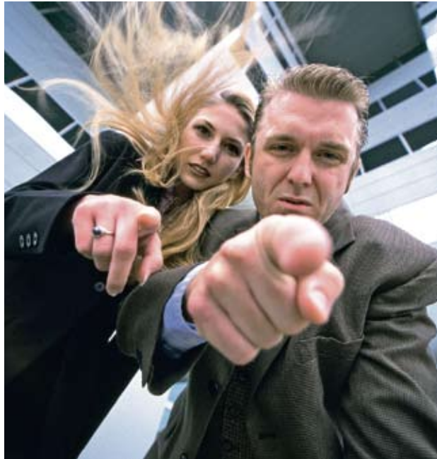
Gestresste fühlen sich von allen und allem bedroht.

BERN/NEW YORK. Wer unter Stress steht, fühlt sich beobachtet – auch wenn das nicht der Fall ist. So das Ergebnis einer Studie der Uni Bern. Die Resultate könnten helfen, Depressive besser zu verstehen.